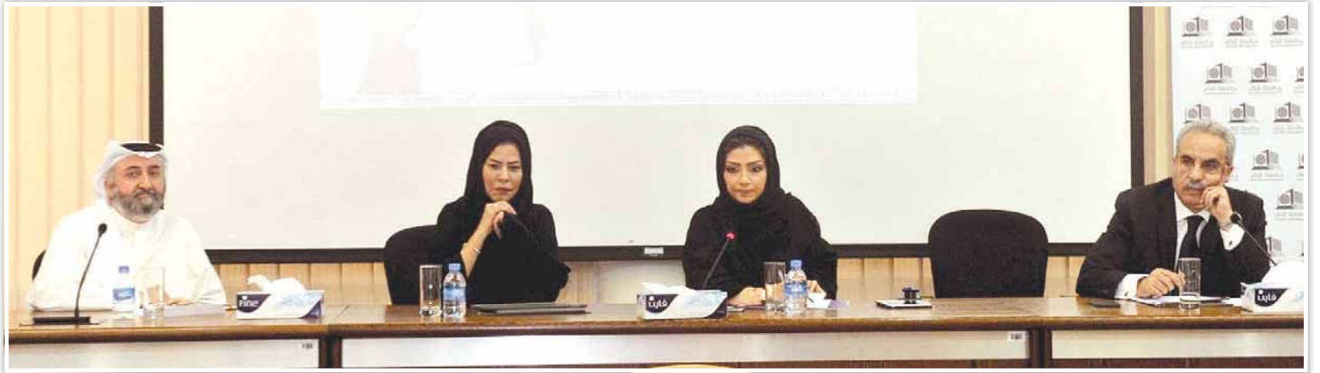
المتحدثون في منتدى الإعلام والحصار

الإعلام القطري تعامل مع الأزمة بحرفية مبنية على الحقائق